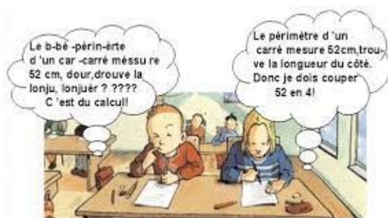
Illustration « dans la tête d'un dys »

→ MILA propose une plateforme internet qui permet de s'informer sur ses recherches et a développé un outil de rééducation pour accompagner les enfants Dys par l'utilisation de la musique et d'activités musicales ludiques.